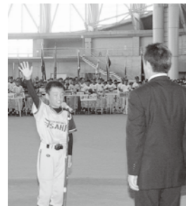
札幌ドームに全選手が集結、元気な選手宣誓で試合開始

恒例の「コープさっぽろ杯第33回日刊スポーツ旗争奪少年野球秋季大会」が'06年度も、約2カ月間にわたって全道各地で開かれました。208チーム4000人の中から勝ち抜いた少年たちが優勝旗を目指し、手に汗握る熱戦を繰り広げました。