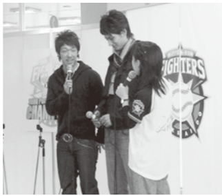
インタビューにこたえる八木選手(左)とダルビッシュ選手

'06年の日本シリーズで見事優勝を果たした、「北海道日本ハムファイターズ」。同チームの人気選手によるトーク&サイン会が、11月22、23の両日、コープさっぽろで開かれました。