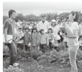
ラジオの生放送で収穫のお手伝いを実況

コープさっぽろ農業賞に応募した真狩村のごとう農園で、生放送のラジオ公開収録ライオン「STVラジオ コープ秋の収穫祭」が行われ、29組99人の家族が収穫にチャレンジしました。